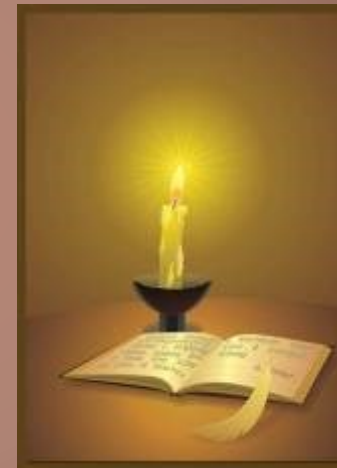
Смотреть на горящую свечу